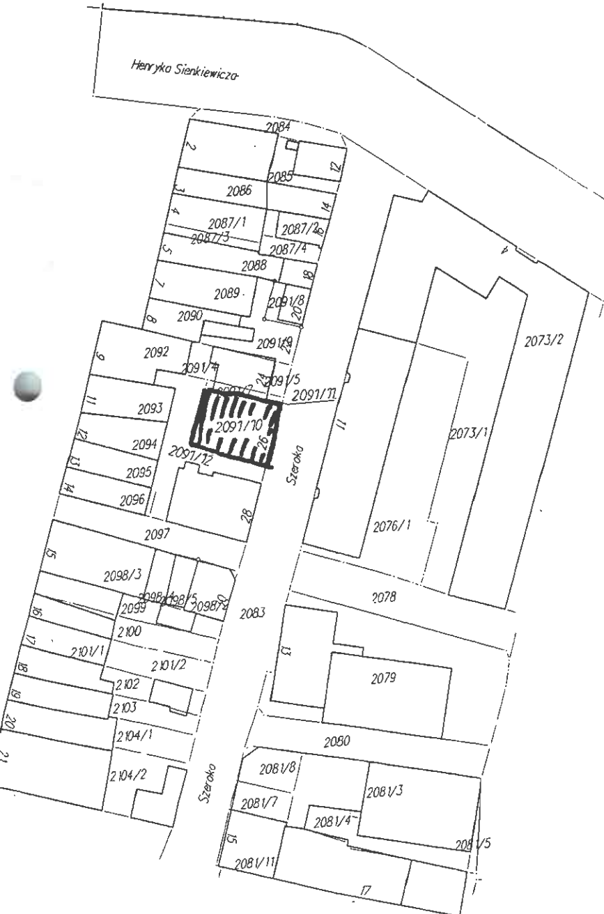
Mapa ewidencji gruntów skala 1 : 1000