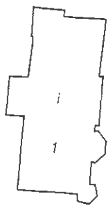
Mapa ewidencji gruntów skala 1 : 1000