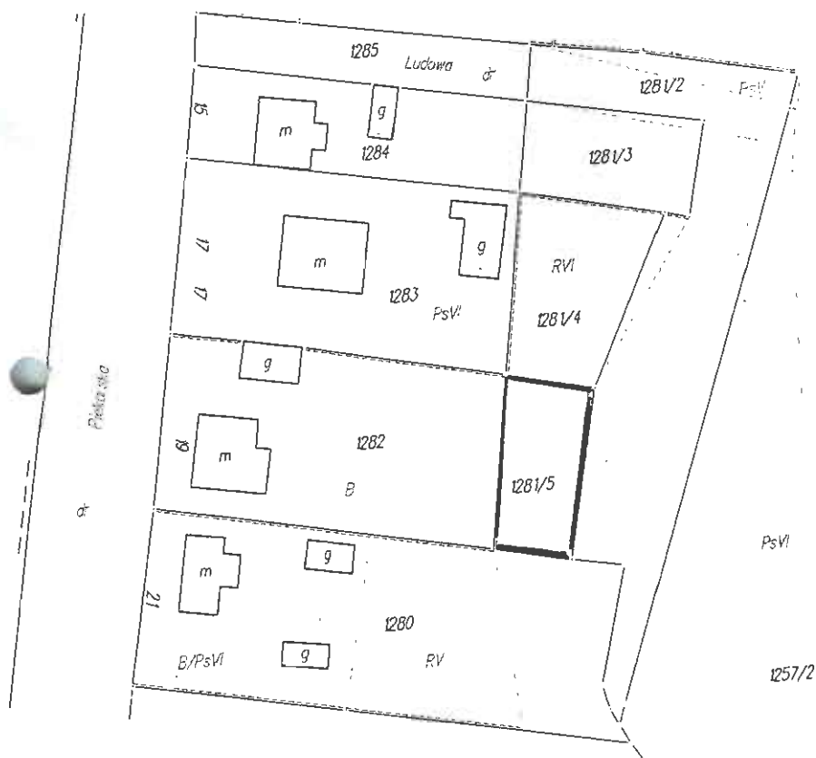
Mapa ewidencji gruntów skala 1 : 1000