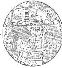
Mapa ewidencyjny gruntów skala 1 : 2000