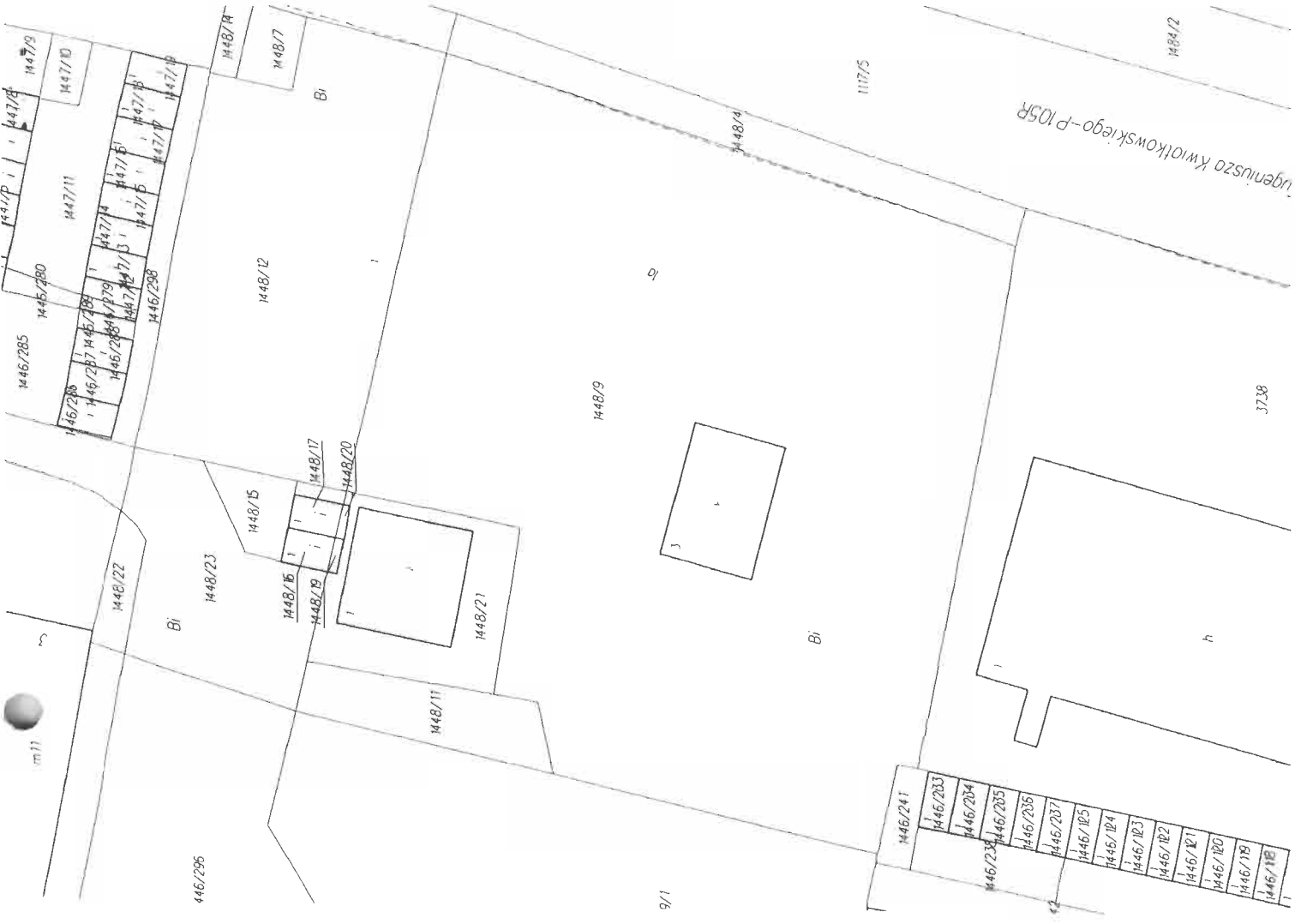
Szkiełko lokalizacyjny w skali 1:10 000