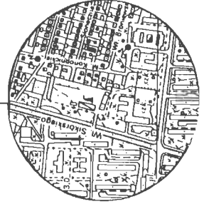
Mapa ewidencji gruntów skala 1 : 1000