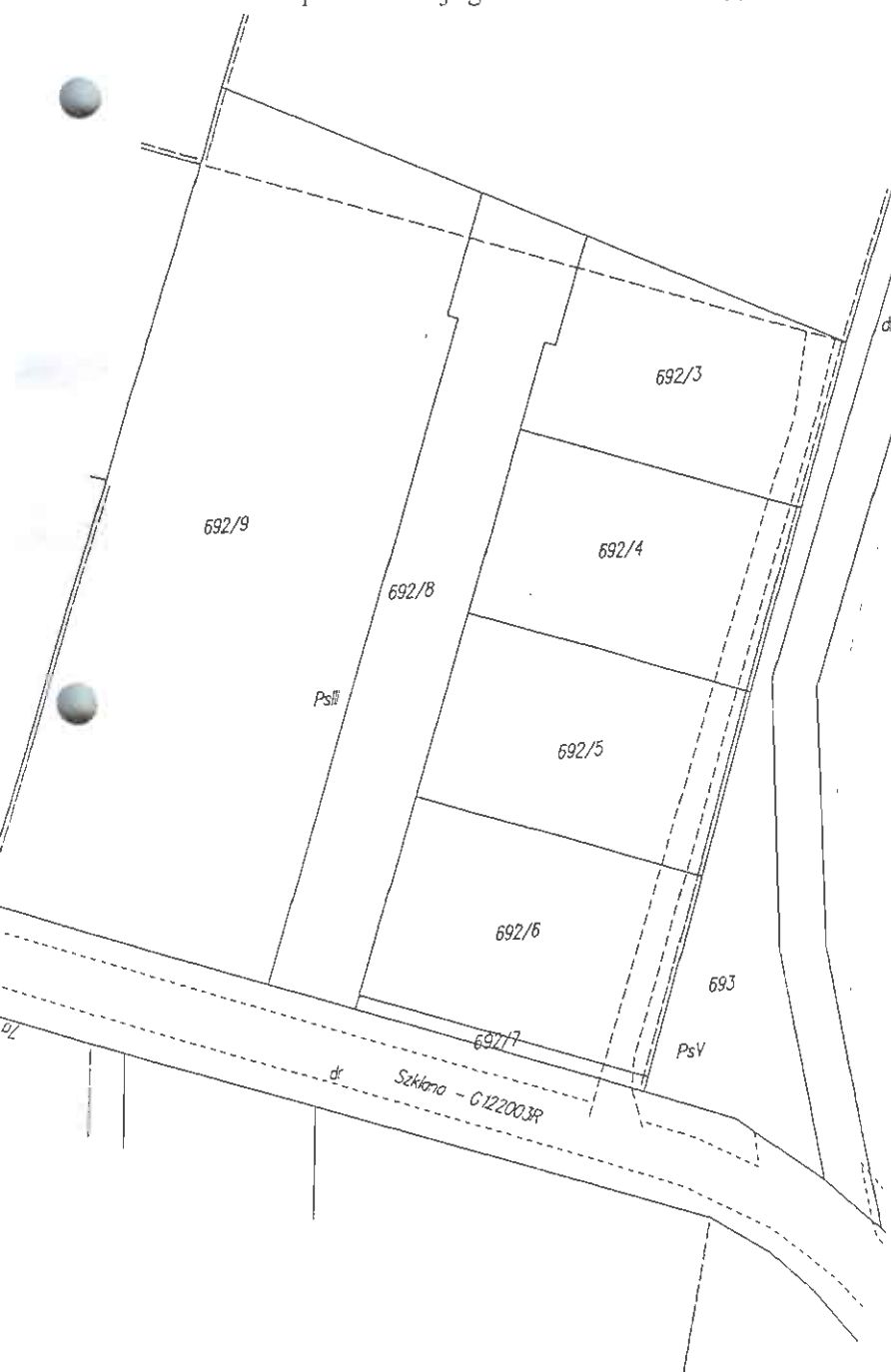
Mapa ewidencji gruntów skala 1 : 1000