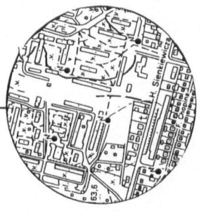
Mapa ewidencji gruntów skala 1 : 1000