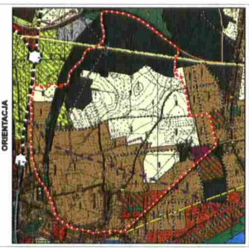
--- granica terenu objętego planem miejscowym