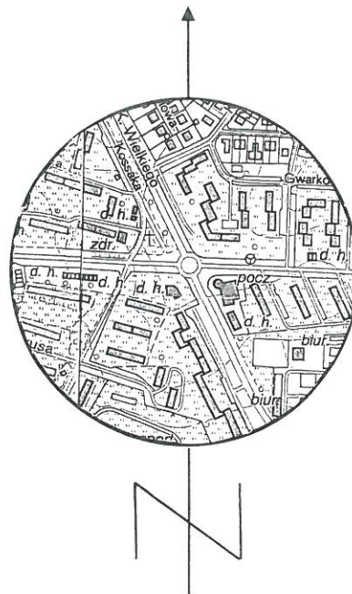
Mapa ewidencji gruntów skala 1: 1000

Działka ewidencyjna nr: 1101/7 Powierzchnia: 0,0555 ha Właściciel: Skarb Państwa Lokalizacja: Tarnobrzeg ul. Kossaka Księga wieczysta: TB1T/00072010/9