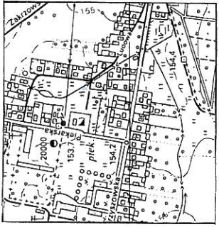
Szkiełko lokalizacyjny w skali 1:10 000