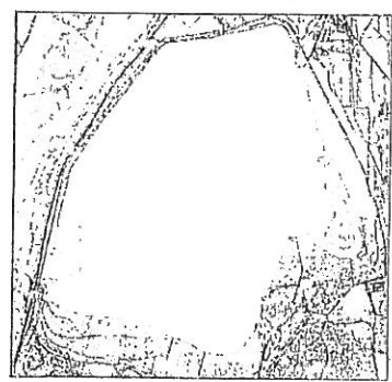
Szkie lokalizacyjny w skali 1:50 000

Właściciel: Skarb Państwa Użytkownik wieczysty: Kopalnia Siarki „Machów” S.A. w likwidacji Lokalizacja: Tarnobrzeg obręb Kajniów działki ewidencyjne nr: 490/1, 485/2 obręb Machów działki ewidencyjne nr: 968/2, 275/5, 976/2, 977/1, 978/4, 974/1 obręb Nagnajów działki ewidencyjne nr: 500/15