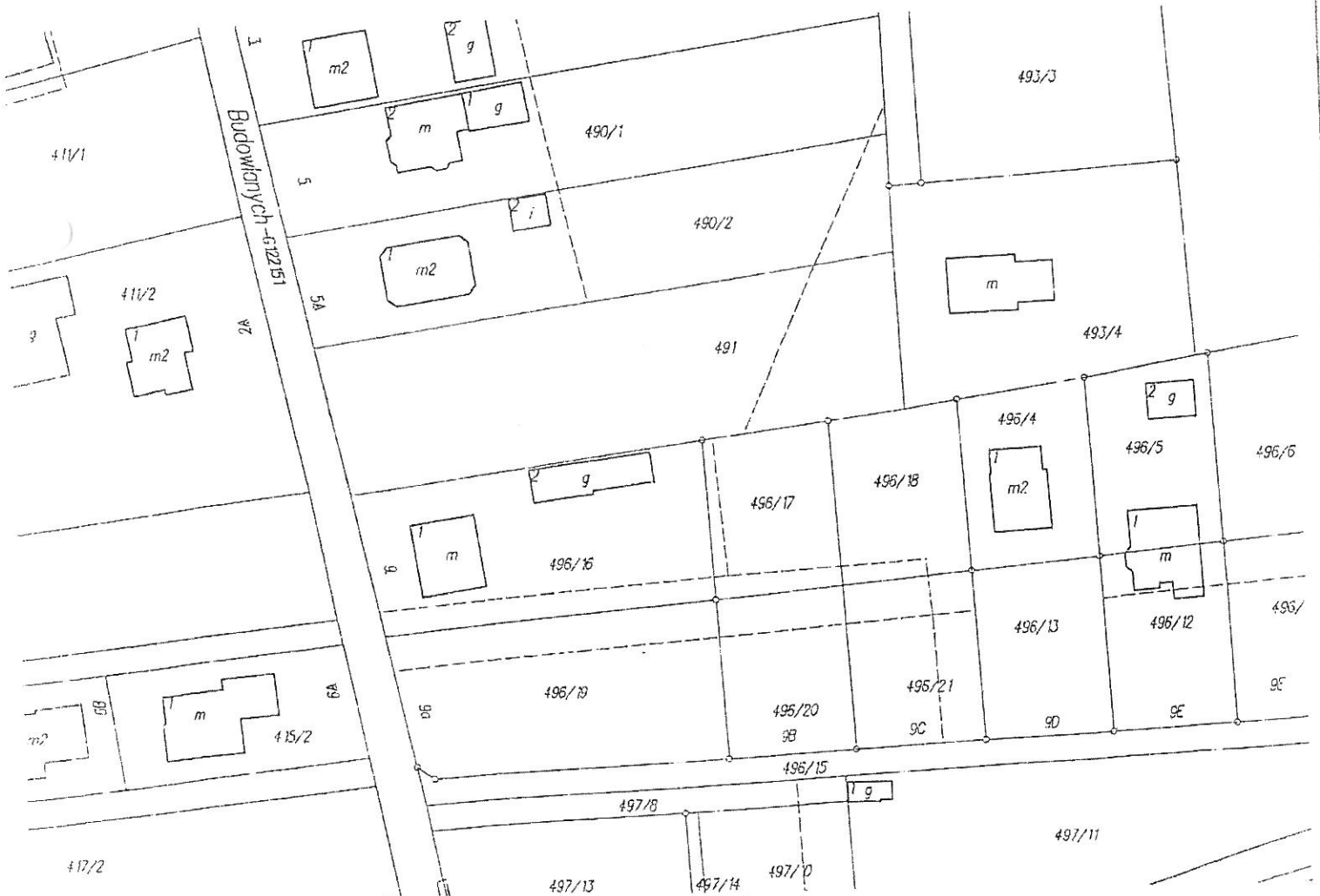
Mapa ewidencji gruntów skala 1: 1000

Działka ewidencyjna nr: 491 Powierzchnia: 0,2182 ha Księga wieczysta: TB1T/00070604/6 Własność: Skarb Państwa Lokalizacja: Tarnobrzeg obręb Miechocin