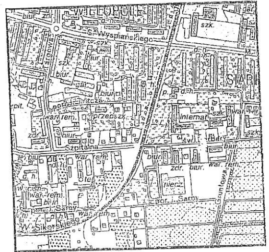
Szkic lokalizacyjny w skali 1: 10 000