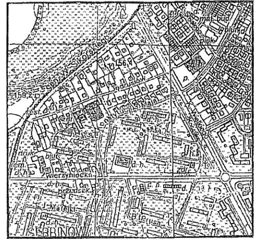
Szkic lokalizacyjny w skali 1: 10 000

Działka ewidencyjna nr: 1056/3 Powierzchnia: 0,0137 ha Księga wieczysta: TB1T/00068362/0 Własność: Gmina Tarnobrzeg Lokalizacja: Tarnobrzeg przy ul. Jędrusiów