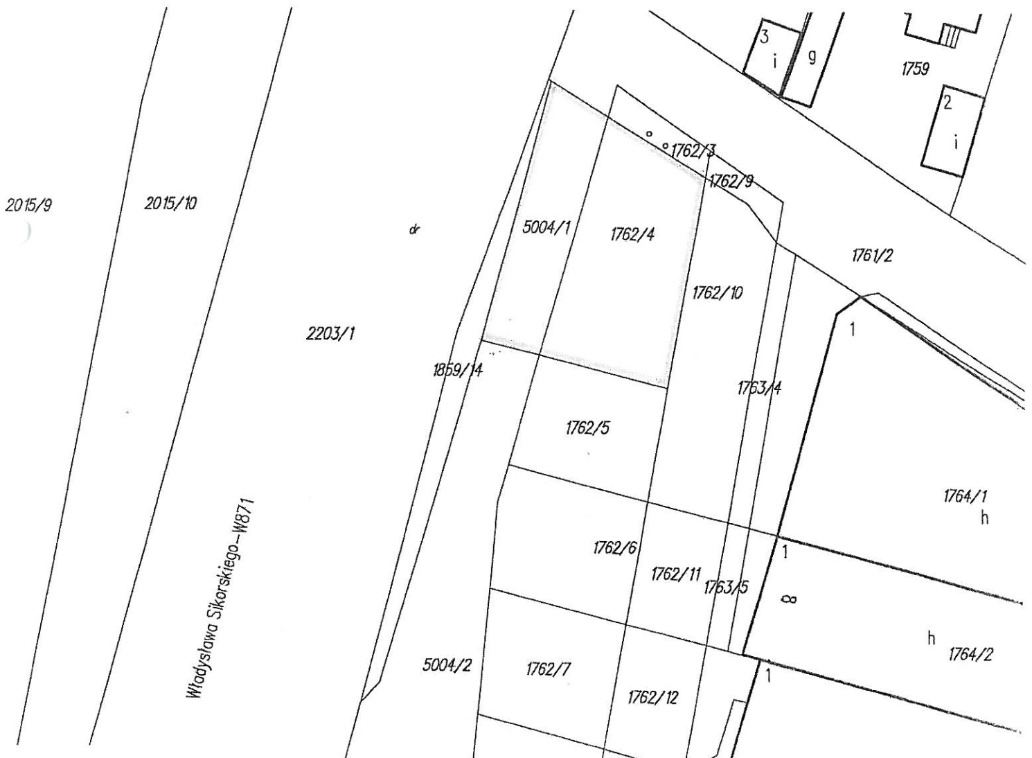
Mapa ewidencji gruntów skala 1: 500