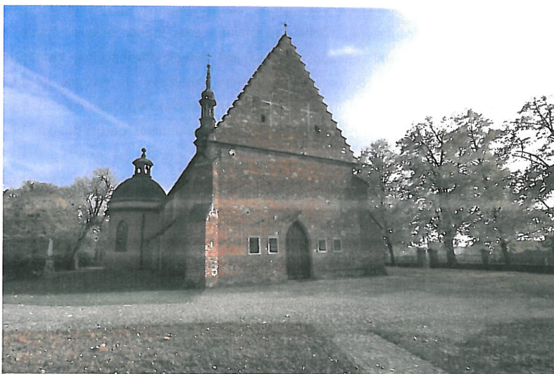
Rysunek 2. Kościół parafialny pw. św. Marii Magdaleny.