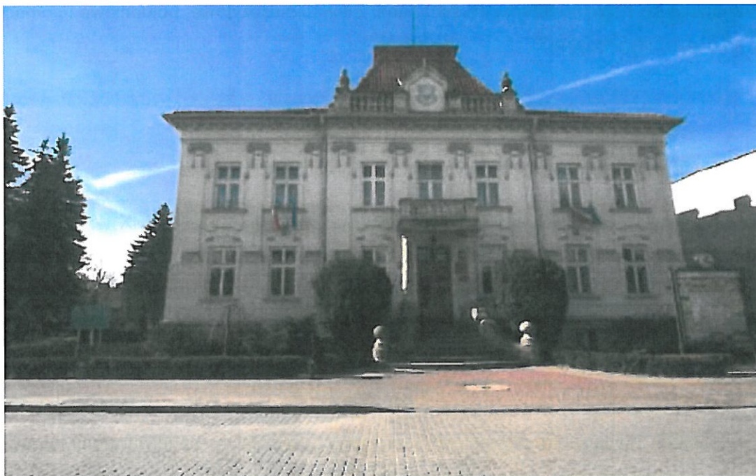
Rysunek 6. Urząd Miejski.

Budynek został wzniesiony w 1910 r., według projektu inż. Nikodemowicza, na potrzeby Rady Powiatowej. W 1915 r. obiekt doznał uszkodzeń. W 1920 r. część gmachu została przekazana na potrzeby gimnazjum im. Hetmana Jana Tarnowskiego.