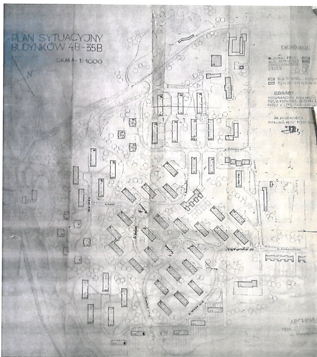
Rysunek 1. Plan sytuacyjny budynków 4B-35B Osiedla „Przywiśle”.

Pierwsze obiekty oddane zostały już w 1958 r. Osiedle „Przywiśle” powstało wzdłuż ul. 1 Maja i L. Waryńskiego i rozbudowało się w kierunku zachodnim i południowym do krawędzi skarpy wiślanej. Teren osiedla zaprojektowany został w oparciu o koncepcję miasta ogrodu. Koncepcja ta sformułowana została w 1898 r. w Anglii przez Ebenezera Howarda, w odpowiedzi na przeludnione pełne brudu i przestępczości ośrodki miejskie. Pomysł Howarda zakładał przeznaczenie miasta dla ok. 35 tys. mieszkańców. Jednostki oparte miały być o plan koła, podzielonego głównymi ulicami na jednakowe części. Poszczególne strefy miały przypisane funkcje, np. usługowe, mieszkaniowe, rekreacyjne. Całość skupiała się wokół centralnego parku.