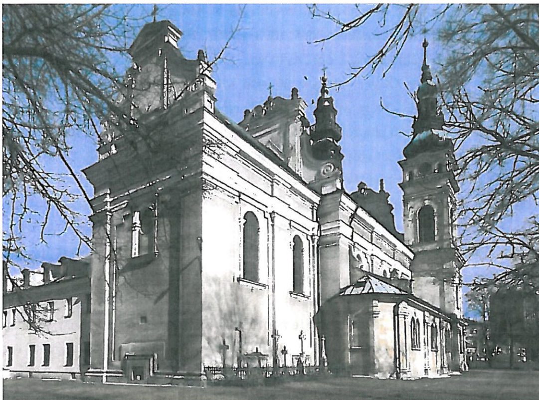
Rysunek 3. Kościół klasztorny pw. Wniebowzięcia NMP, ob. kościół parafialny.

prostokątne z półkolistym gładkim tympanonem. Kościół jest obiektem trójnawowym, bazylikowym. Nawa główna jest szersza i wyższa od naw bocznych, zakończona jest węższym, prostokątnym prezbiterium, zamkniętym prostą ścianą. Nawy boczne są zamknięte od wewnątrz półkoliście, od zewnątrz wieloboczną absydą. Od wschodu na osi znajduje się kruchta zbudowana na rzucie prostokąta zbliżonego do kwadratu. Na osi naw bocznych znajdują się dwie wieże na rzucie kwadratu.