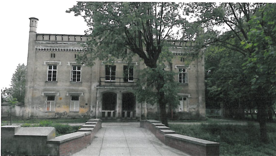
Rysunek 5. Kuchnia w Pałacu Tarnowskich w Dzikowie.

Budynek powstał na planie zbliżonym do litery „L”. Korpus główny jest dwu i półtraktowy. Skrzydło północno – wschodnie jest jedno i półtraktowe. Poddasze zajmuje całą powierzchnię rzutu budynku. Obiekt jest częściowo podpiwniczony. Korpus główny jest piętrowy, skrzydło północno – wschodnie jest parterowe. Bryła budynku jest prostopadłościenna, podzielona na trzy człony, różniące się gabarytem, kompozycją, detalem architektonicznym elewacji oraz grubością murów.