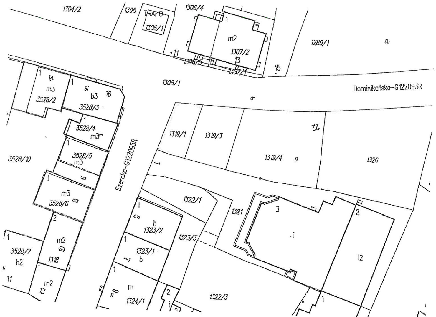
Mapa ewidencji gruntów skala 1: 500

Działka ewidencyjna nr: 1319/1 Powierzchnia: 0,0084 ha Księga wieczysta: TB1T/00067989/4 Własność: Gmina Tarnobrzeg Lokalizacja: Tarnobrzeg przy ul. Dominikańskiej