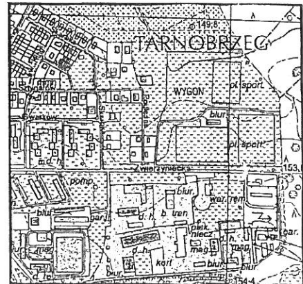
Szkic lokalizacyjny w skali 1: 10 000