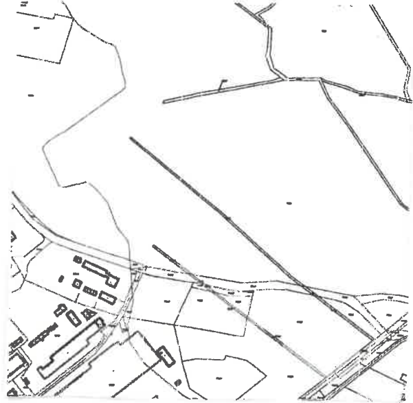
Szkic lokalizacyjny w skali 1 : 10 000